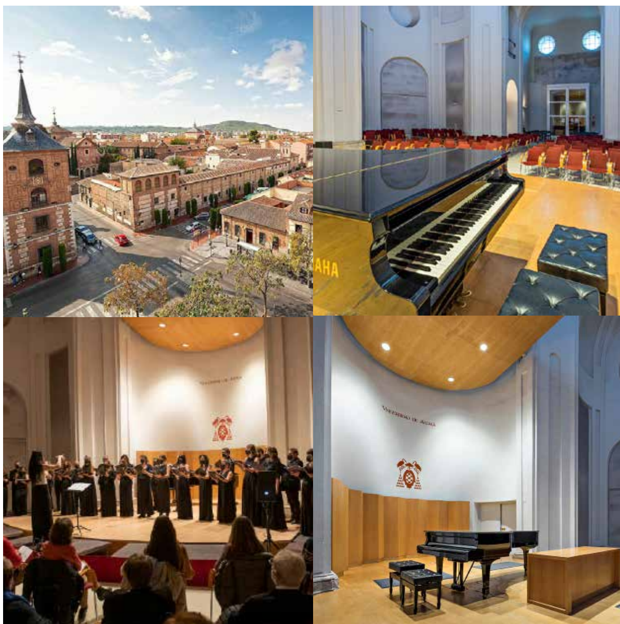
Alcalá de Henares | Aula de Música UAH

Los espacios dedicados a la realización de este curso introducen al alumno en un entorno donde la música es protagonista y lo invitan a no visualizar más límite que sus deseos de mejorar.